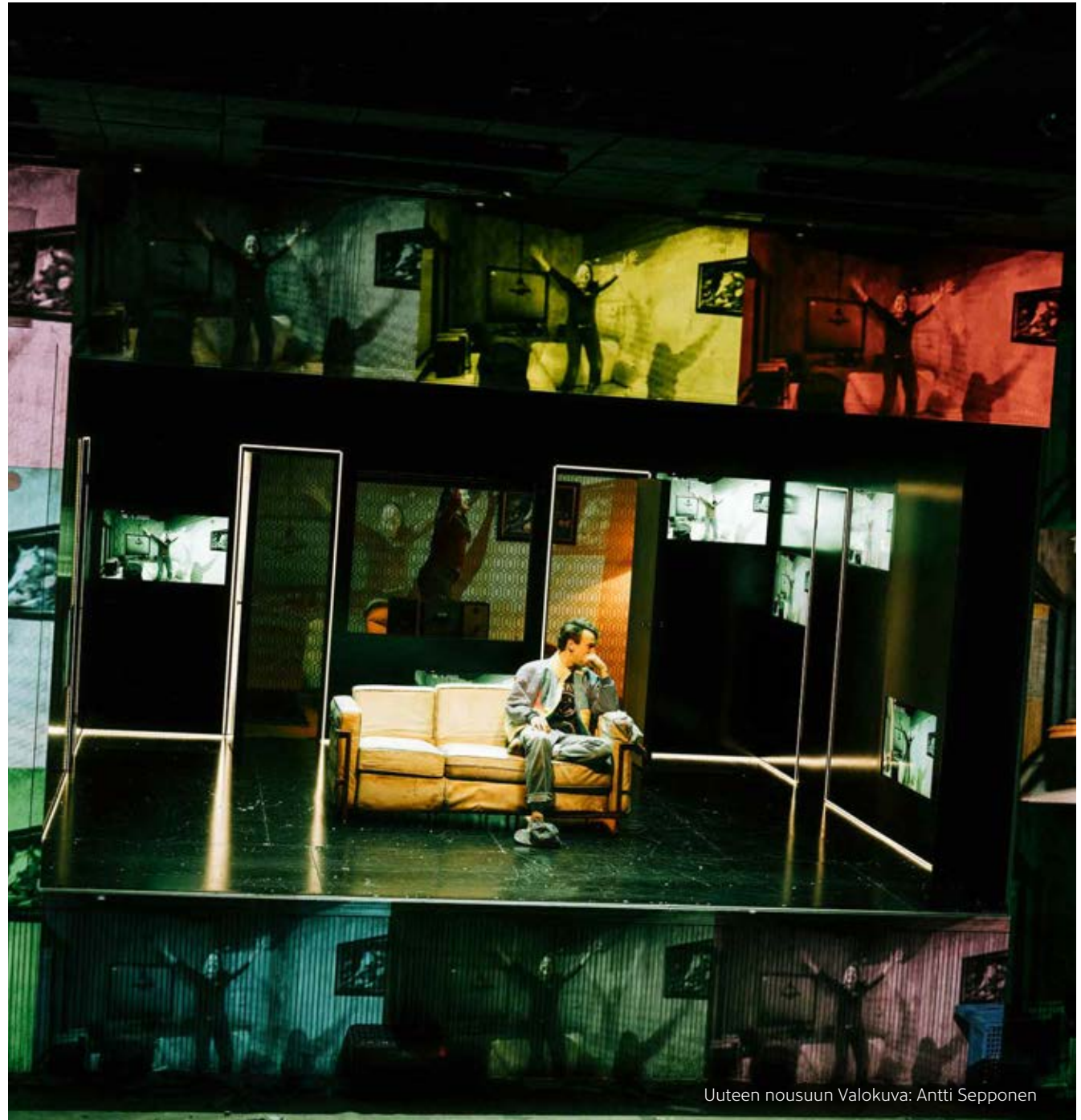
Uuteen nousuun